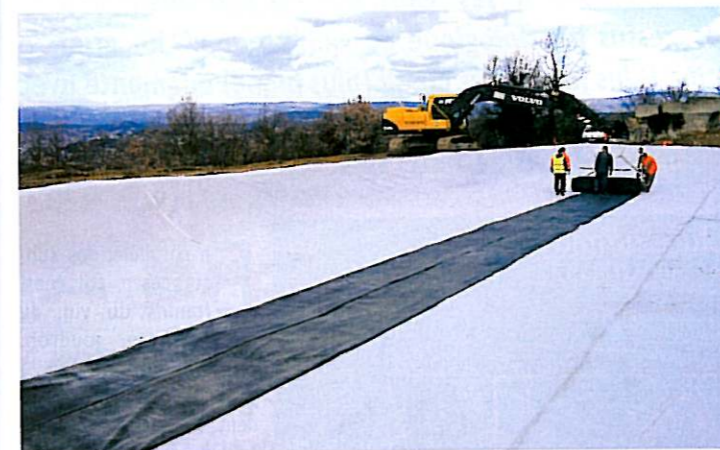
Pose de la géomembrane étanche

Puis le dispositif d'étanchéité par géomembrane certifiée peut être installé : il permet d'éviter l'infiltration des effluents dans le terrain naturel.