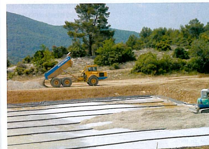
Remplissage des bassins en granulats