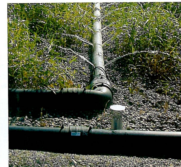
Alimentation d'un 2ème étage

Il reste ensuite à poser les ouvrages et équipements divers pour l'alimentation en eaux usées, puis à mettre en route la station.