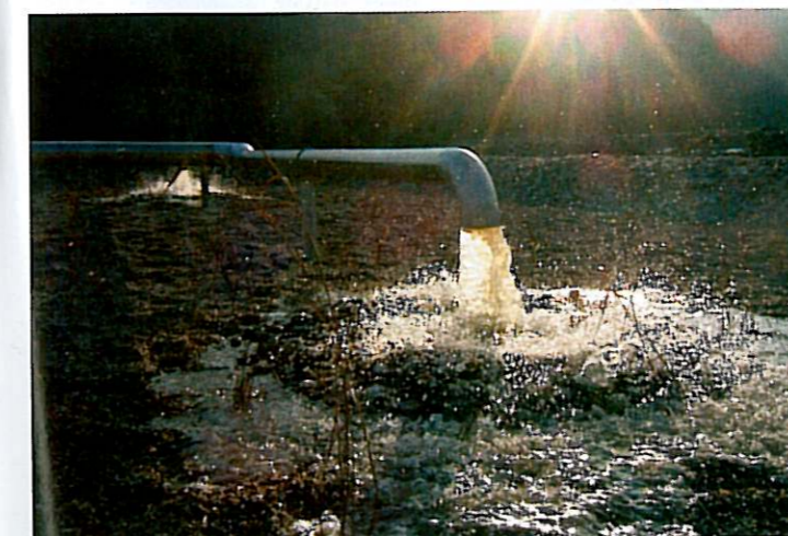
Alimentation d'un premier étage avant la pousse des roseaux

Ensuite c'est la pose des drains de fond de filtres pour canaliser les effluents afin de les renvoyer vers la suite de la station.