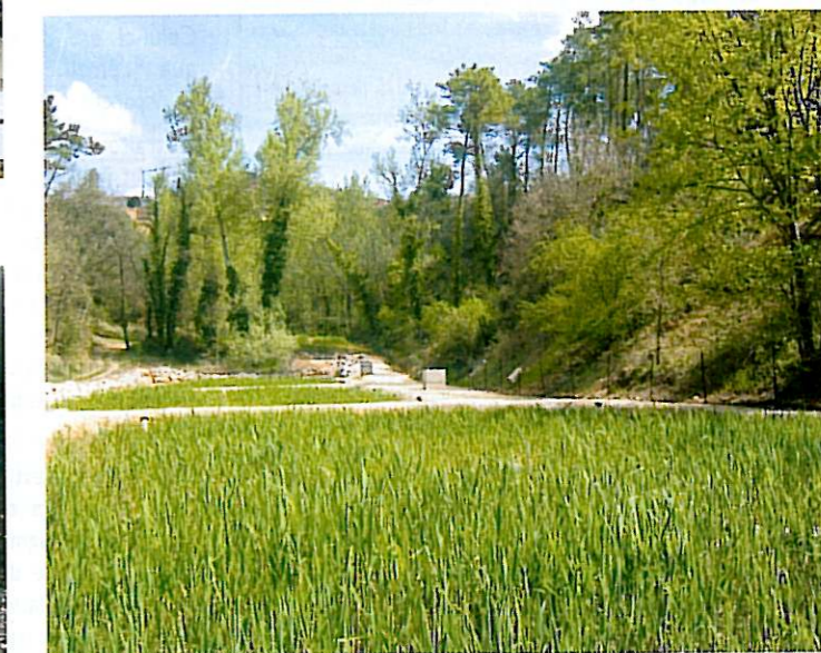
Station terminée, des roseaux en bonne santé

Car la priorité, c'est de toujours préserver la qualité des cours d'eau.